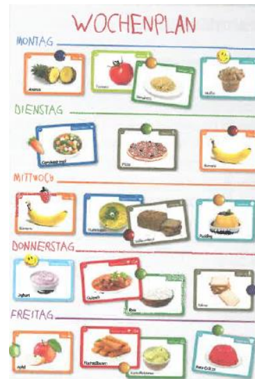
Mahlzeit! Der Kita-Speiseplan, Don Bosco

Ein bebildeter Speiseplan, der die einzelnen Komponenten aufführt, verschafft den Kindern die Möglichkeit, sich selbst eine Vorstellung von den Speisen zu machen, die einzelnen Komponenten zu erkennen und zu benennen. Dieser hängt in allen Kitas in Sichthöhe der Kinder.